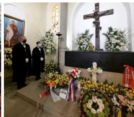
Rakev Karla I. na Monte