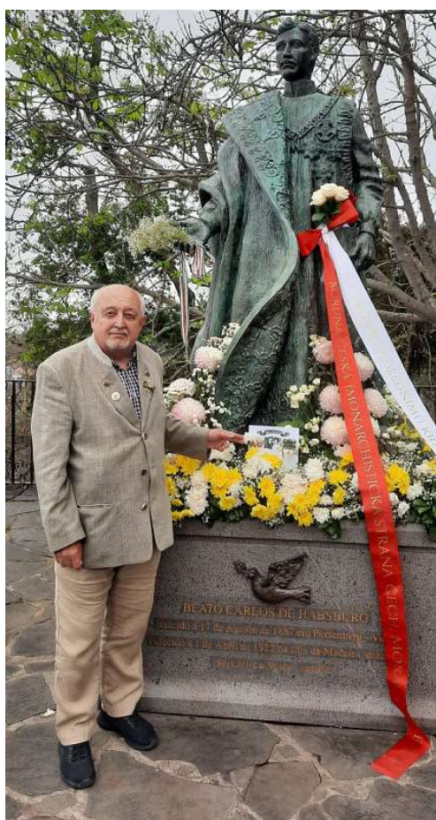
Socha Karla I. na hoře Monte (Madeira 1.4.2022)