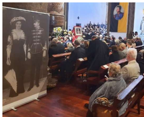
Mše v katedrále Funchal