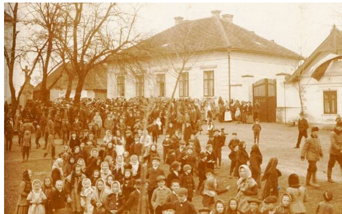
Uvítání arcivévody Karla v Kostelní Lhotě r.1912