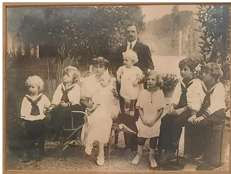
Karel I. s rodinou na Madeiře 1922